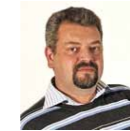
Af Robert Larsson

Hen ved 500 børn og voksne deltog i Tele Øst's juletræsfest den 22. november i Brøndby Hallen. Søndagen gik med sang og dans omkring det store juletræ, sanglege, pakker og sjov. Nissen Kogle med nissepigerne malede ansigter på mange af børnene, og julemanden og hans kone gik med rundt om det store træ og tryllede. En dejlig juletræsfest, som blev optakten til december måned og julen 2009.