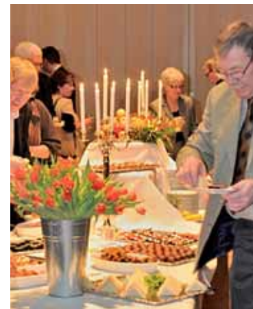
Trængsel omkring den velmagende buffet.