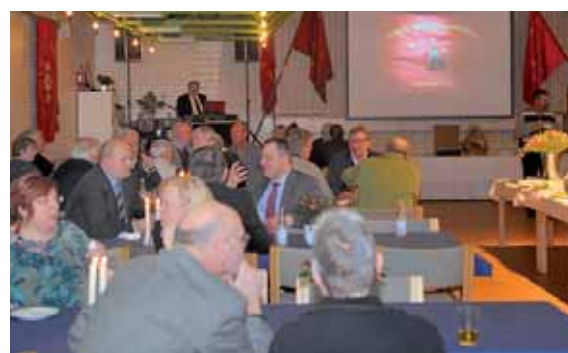
Hyggelig snak blandt kollegaer.