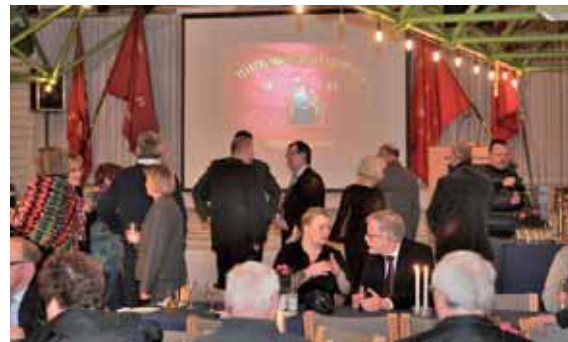
Tid til faglig snak.