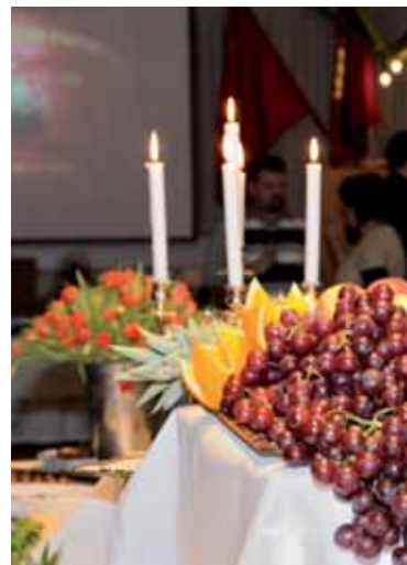
En utrolig flot arrangeret og velmagende buffet