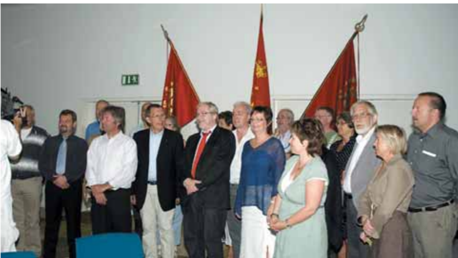
Bestyrelsen i det nye Tele Øst samlet til fotografering.

Taler og lykønskninger var der mange af og vi bringer her et lille udpluk af de mange taler: Af pladshensyn har vi været nødt til at afkorte talerne og der har desværre heller ikke været plads til dem alle.